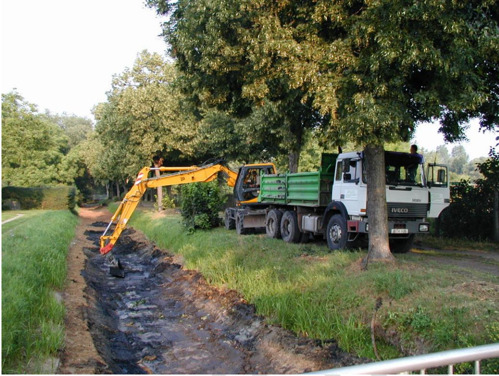
Herstellung des ursprünglichen Gewässerprofils