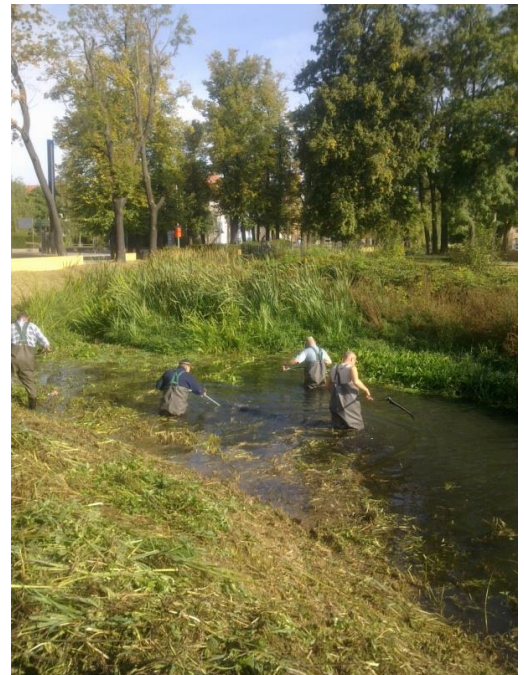
Sohlkrautung mittels Handarbeit