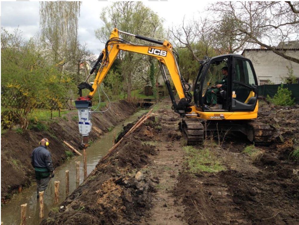
Einbau von Faschinen zur Böschungssicherung und Erhalt des Gewässerprofils