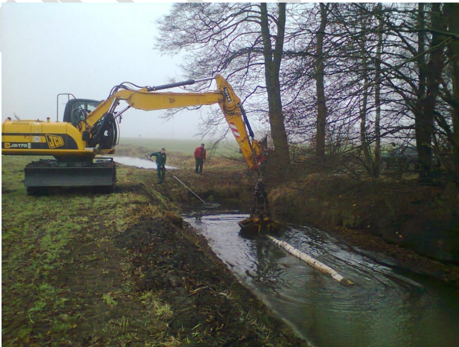
abflusssichernde Maßnahme, Freimachen eines verstopften Durchlasses