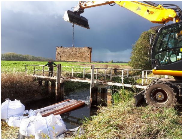
Mittlere Anlage während