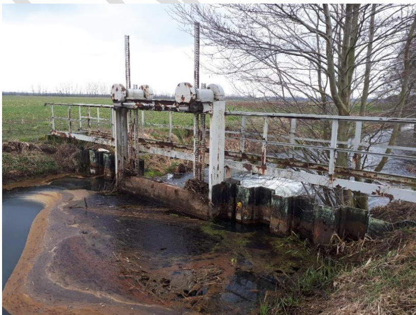
Mittlere Anlage vorher (eingeschränkt betriebsfähig)