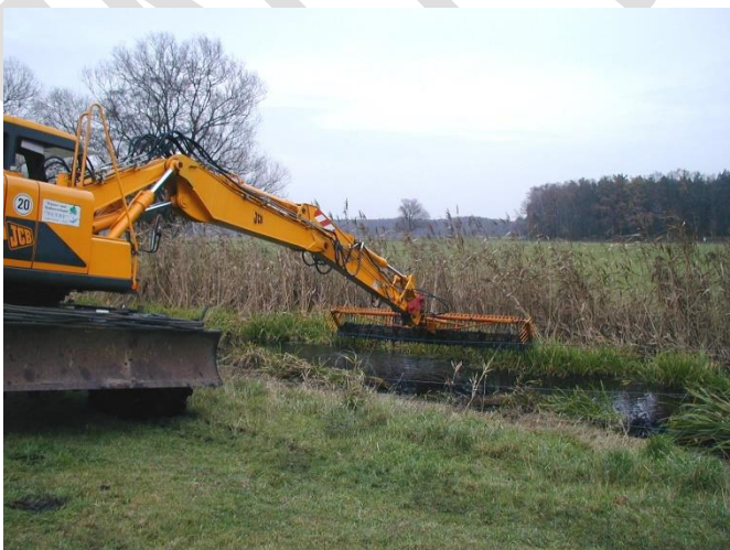
Sohlkrautung mittels Bagger mit Mähkorb