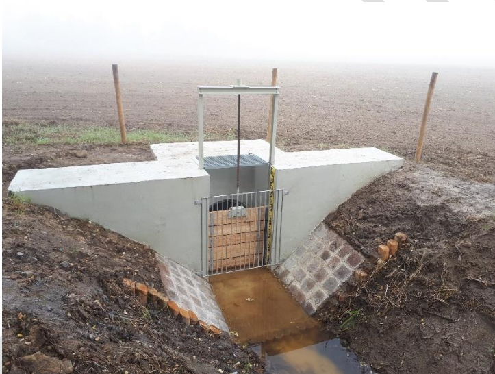
Kleine Anlage danach (vollständig betriebsfähig)