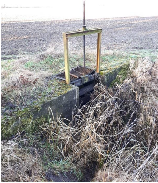
Kleine Anlage vorher (eingeschränkt betriebsfähig)