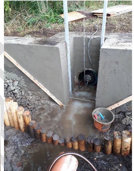
Kleine Anlage während