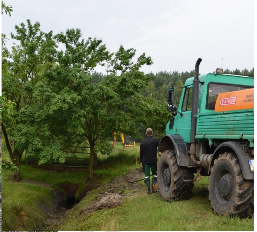
Einsatz Hochdruckspülgerät mit Räumdüse an einem Durchlass