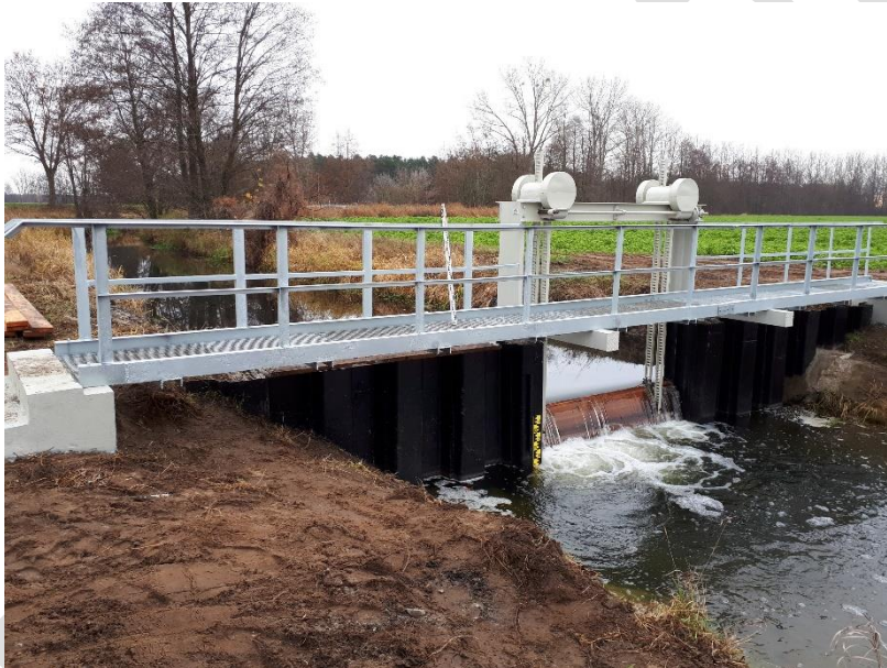
Mittlere Anlage danach (vollständig betriebsfähig)